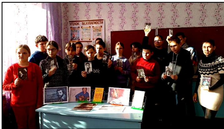
Рис. 2: Литературный час «Я все вопросы освещу сполна...»

В рамках цикла мероприятий к 85-летию со дня рождения В.С. Высоцкого, библиотека-филиал для детей №7 Муниципального бюджетного учреждения «Централизованная библиотечная система администрации города Шахтёрска» провела для обучающихся МБОУ «Шахтёрская основная школа №21» литературный час «Я все вопросы освещу сполна...».