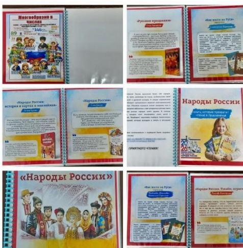
Рис. 7. Рекомендательный список литературы.

С появлением современной техники и программного обеспечения появилась возможность оформлять книжные выставки и информационные стенды на более современном уровне. В этой связи хотелось бы представить на суд коллег недавно разработанные информационные списки литературы, которые и выглядят красиво, и пользоваться удобно, в отличие от привычных листиков, скрепленных скрепками, лежащих на полках.