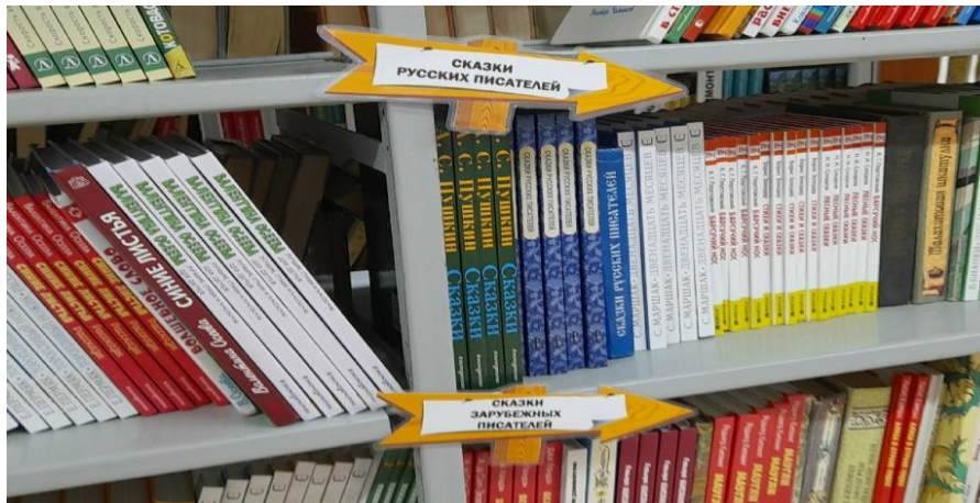
Рис.2. Указатели в виде стрелок, размещенные на стеллажах, для младших школьников.

Так же считаю целесообразным более яркое оформление не только заголовков выставок, но и таких, казалось бы, мелочей, как полочные разделители и указатели.