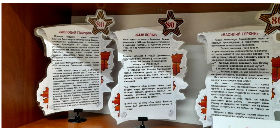
Рис.5. Реклама книг – юбилеев с описанием.

Весьма интересный вид работы — это комплексное оформление мероприятия. В едином стиле оформляются и пригласительные билеты, и афиши, и дипломы участников. Все это выстраивается в фирменный стиль, узнаваемый и запоминающийся, что особенно важно для таких мероприятий, как фестивали и ежегодные праздники. В оформлении литературной гостиной и залов можно использовать элементы сценических декораций. Все они усиливают эффект от сценического действия, создают впечатление присутствия другого времени, другую атмосферу, обогащают и развивают художественное содержание мероприятия.