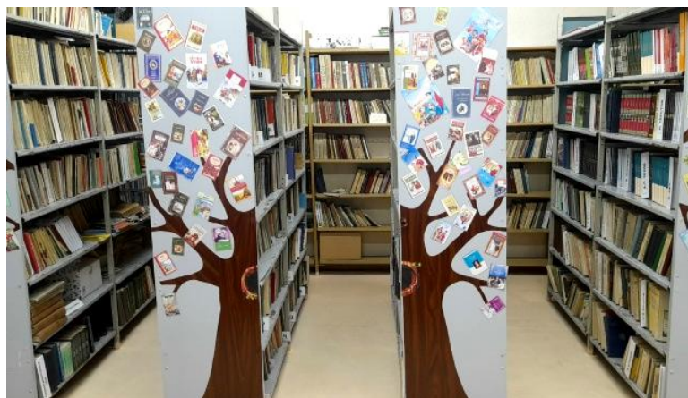
Рис.1. Картинки обложек книг, которые размещены на стеллажах, для старших школьников.

Правильная и удобная расстановка книг на стеллажах и полках является немаловажным фактором привлечения внимания читателя. Книги на стеллажах должны быть расставлены не только по правилам, но и с учетом возраста и интереса читателей. Указатели на стеллажах должны быть не скучными и однообразными, а возможно, стать «квестом» для читателя в поиске книги.