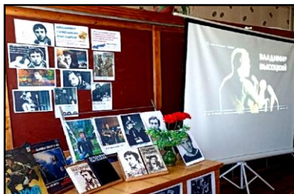
Рис. 1. Фрагмент литературно-музыкальной композиции «Если друг оказался вдруг...»

встречи было рассказано о жизни и творчестве великого советского поэта, актёра театра и кино, автора и исполнителя песен. Заметно оживил рассказ ведущей видеоряд интересных фотографий из разных периодов жизни автора-исполнителя и кадры из кинофильмов с его участием. Гости вечера, а это была в основном молодежь, в очередной раз получили возможность убедиться в многогранности таланта этой неординарной личности – В.С. Высоцкого.