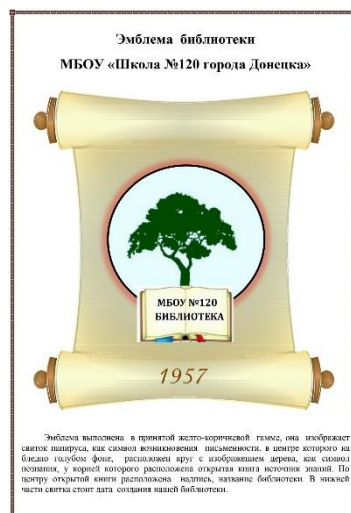
Рис.4. Эмблема школьной библиотеки.

Эмблема выполнена в принятой желто-коричневой гамме, она изображает свиток папируса как символ возникновения письменности, в центре которого на бледно-голубом фоне расположен круг с изображением дерева как символа познания, у корней которого расположена открытая книга - источник знаний. По центру открытой книги расположена надпись - название библиотеки. В нижней части свитка стоит дата создания нашей библиотеки.[3]