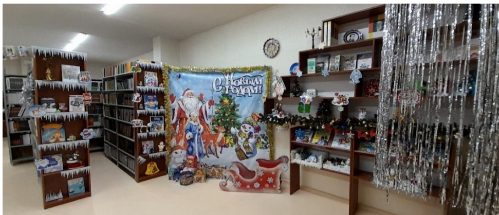
Рис.6. Оформление библиотеки к Новогодним праздникам.

Весьма интересный вид работы — это комплексное оформление мероприятия. В едином стиле оформляются и пригласительные билеты, и афиши, и дипломы участников. Все это выстраивается в фирменный стиль, узнаваемый и запоминающийся, что особенно важно для таких мероприятий, как фестивали и ежегодные праздники. В оформлении литературной гостиной и залов можно использовать элементы сценических декораций. Все они усиливают эффект от сценического действия, создают впечатление присутствия другого времени, другую атмосферу, обогащают и развивают художественное содержание мероприятия.